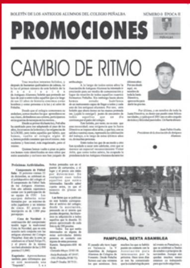
Portada del Boletín editado en el año 2000