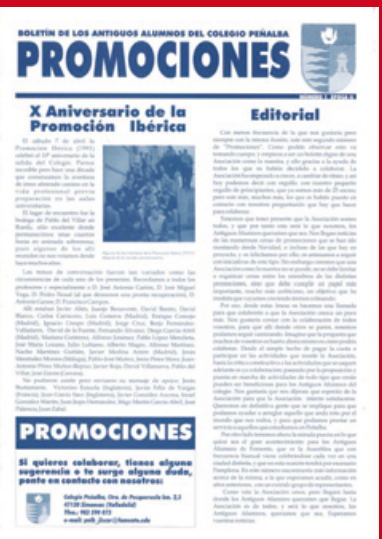
Portada del Boletín editado en el año 2001