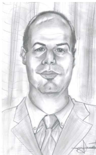
Ilustración: Javier Redondo

... Además tienen en un pedestal tanto a los padres como al profesor; lo que nos hace la vida más fácil... "Porque D. Javier ha dicho... , hoy D. Juan ha..."