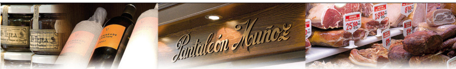
Nuevo establecimiento en la calle San Blas nº 2

Pues sí, mira, entre Pinoalbar y Peñalba pasé junto a mis compañeros prácticamente mis primeros quince años, y ellos, junto a los profesores, marcaron mi vida. Desde aquí quiero mandarles un saludo cariñoso a todos y desearles que podamos encontrarnos pronto. ¡Ellos ya saben dónde pueden encontrarme, ja, ja!