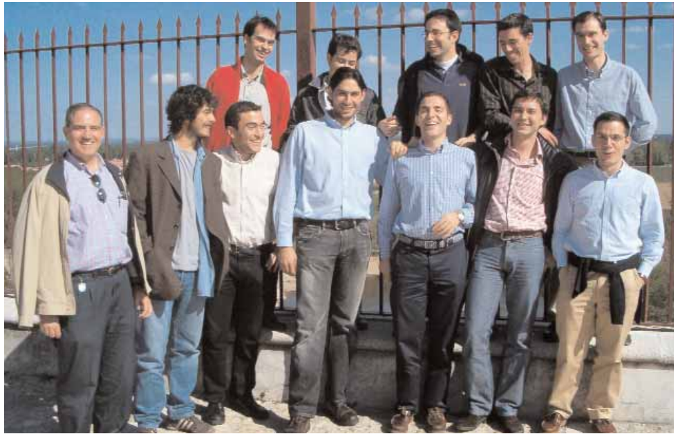
Después de la comida, una foto desde el mirador de Simancas, antes de bajar a Peñalba.