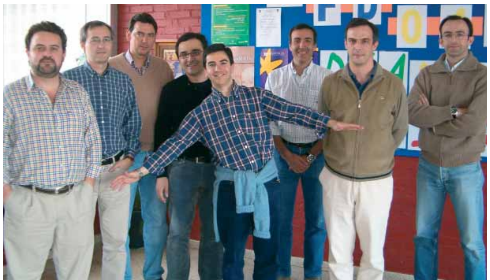
Después de veinte años, aun seguimos bromando en el hall de Peñalba